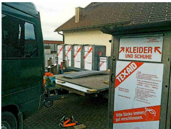
Wer die richtigen Gesprächspartner hat, findet auch leichter neue Stellplätze für Kleidercontainer.