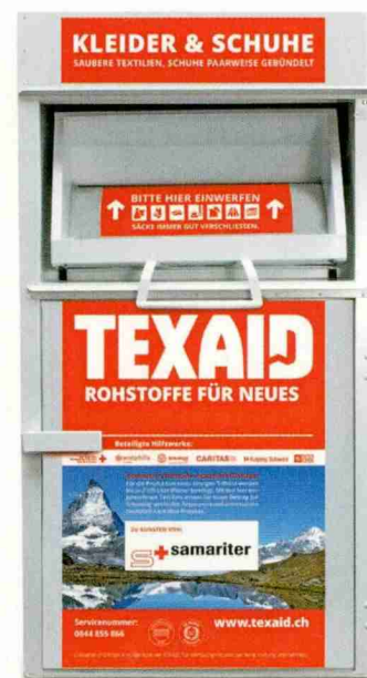
Die Zusammenarbeit mit der SSB-Partnerin Stiftung Texaid ermöglicht es Vereinen, etwa ihr Kurswesen auszubauen.