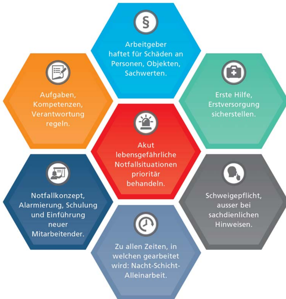
Abbildung 336-2: Bausteine des Notfallkonzepts

satz im Betrieb entstehen, haftet grundsätzlich der Arbeitgeber (Art. 328 in Verbindung mit Art. 101 OR).